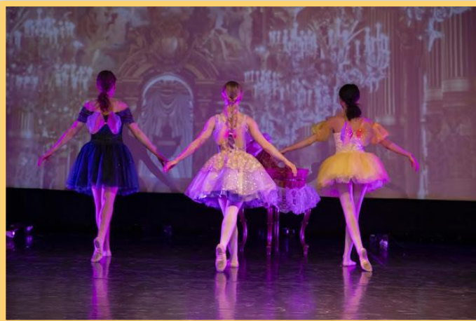
Kevätnäytös 2024, Prinsessa Ruusunen -baletti.

Baletin etäopetuksesta pystyttiin luopumaan syksystä 2024 alkaen. Baletin opetus tapahtui kokonaan lähiopetuksessa.